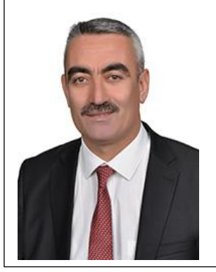
Hüsamettin ÜNSAL Belediye Başkanı ve Encümen Başkanı