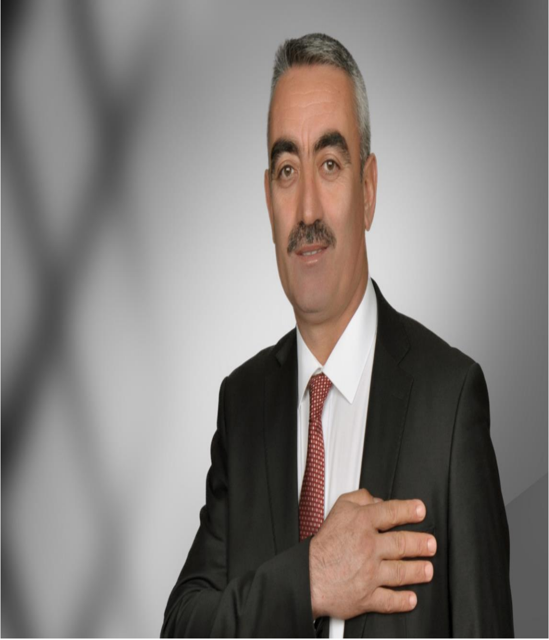
HÜSAMETTİN ÜNSAL EVREN BELEDİYE BAŞKANI