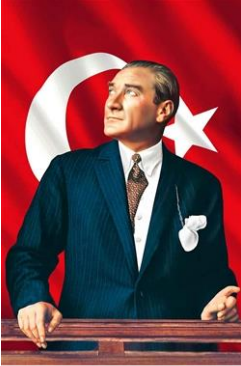
Mustafa Kemal ATATÜRK T.C. Kurucusu