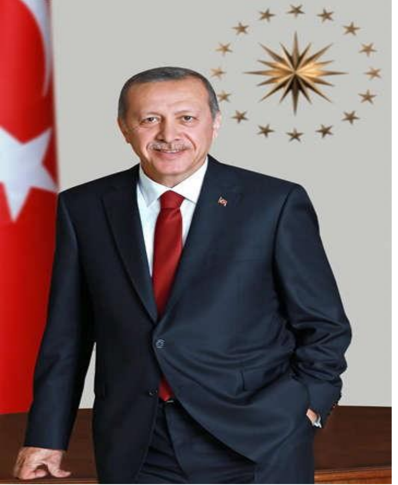
RECEP TAYYİP ERDOĞAN